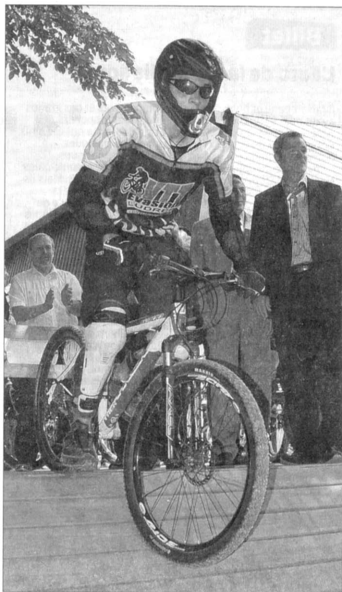
■ Prêt pour la descente vertigineuse.

bleue, rouges (2) et noire, le « VTT Parc » est doublé d'un baby-parc avec son parcours sécurisé en calcaire et cinq modules d'initiation normalisés. Sur le terrain apporté par la ville de Ludres, qui a cofinancé à hauteur de 20 000 € le parc, près de 30 tonnes de calcaire concassé et carrossable ont été nivelées : « Il s'agit d'un gros effort, dont j'espère que les